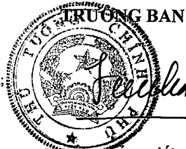
PHÓ THỦ TƯỚNG Lê Minh Khái