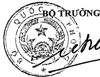
Đại tướng Ngô Xuân Lịch